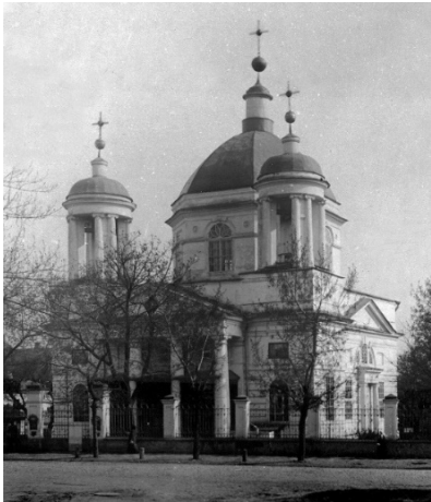
Рис. 2. Церква Миколи Доброго (зруйнована 1935 р.) [4]

Напроти знаходиться найбільша церква Покровської вулиці з однойменною назвою – Покровська. Якою була барокова церква Покрови, ми не знаємо, бо після пожежі (1811) вона втратила оригінальну грушоподібну форму бань і окремі елементи декору. Покровська церква має «сестру» – Михайлівську церкву в м. Вороніж на Сумщині, але там замість трьох один барабан, а його баня більша діаметром. Тепер три верхівки Покровської церкви мають бані ампірної форми. Якщо глядач перебуває на рівні Покровської вулиці, йому здається, ніби церква п'ятибанна. Цього, мовляв, потребує хрещатий план церкви (чотири бані над кожним з рамен і одна баня в центрі) і вигляд високих дугастих фронтонів над північним, південним і східним фасадами церкви. Архітектор церкви І.Григорович-Барський у даному випадку відійшов від Мазепиної традиції п'ятибаних українських церков із пірамідальною композицією початку ХVIII ст. Бані митець розташував за народною традицією, притаманною дерев'яній, церковній архітектурі типових тридільних храмів. Попервах церква була двоповерховою і мала входи через мальовничі ганки з півночі й півдня – на кшталт Богородичного собору в Козельці. Із західного боку ганок ліквідували під час реконструкції на початку ХІХ ст.