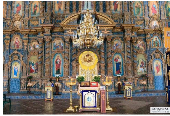
Рис. 5. Іконостас собору Різдва Богородиці у м.Козельці (Чернігівська обл.) [5]

Загалом, розміщення церков Києво-Подолу відображає зміни у плануванні Подолу та його головної вулиці, так вони були сконцентровані на старій головній вулиці – Покровській (перед цим вона називалася Велика Мостова). Це: Покровська церква з двоярусною дзвіницею, яка продовжує традицію українського церковного будівництва, коли дзвіниця стояла окремо від церкви; церква Миколи Доброго – від неї залишилася кам'яна дзвіниця, постанала 1718 р.; комплекс Флорівського жіночого монастиря з Вознесенською головною церквою 1722-1732 рр. будівництва тощо. Залишається додати, що поки що туристичний потенціал українських церков Києво-Подолу використовується далеко не повністю, як і туристичні ресурси самого Подолу, як некоронованої столиці гетьманської України. Наприклад, немає туристичного довідника «Києво-Поділ: минуле, сучасне, майбутнє» (назва орієнтовна) [6]. А для туристів, українських та іноземних, екскурсія «Середньовічний Києво-Поділ – некоронована столиця гетьманської України» повинна бути в переліку обов'язкових туристичних заходів міста, що є особливо актуальним у сучасних умовах російської агресії [7]. Натомість, судячи з оголошень біля подільських церков, таких як Іллінська чи Флорівський монастир, спостерігалось досить багато пропозицій паломницьких турів від паломницько-туристичних центрів (наприклад, «Істок») на новорічно-різдвяні поїздки у 2023 р., приміром, до Почаївської лаври, православних скитів в Україні, до Румунії (автобусний тур) та Грузії (авіатур через Польщу).