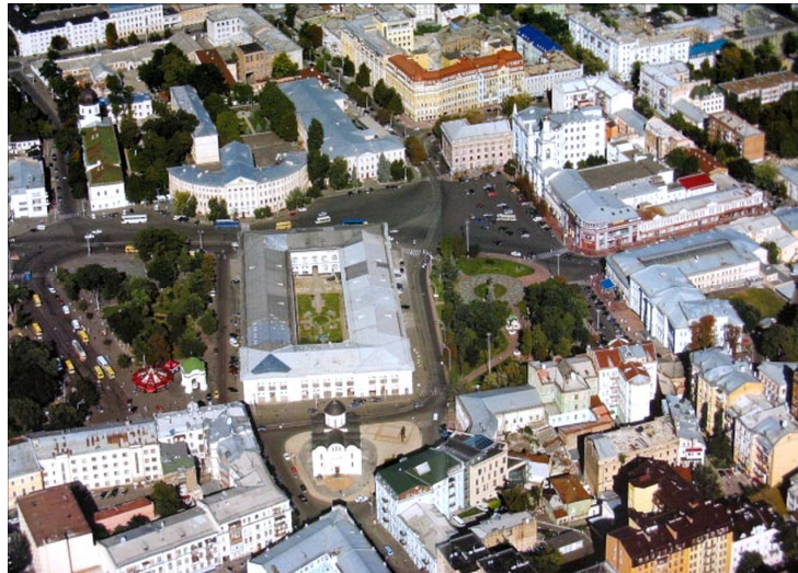
Рис. 1. Контрактова (Житньоторзька) площа – центр Києво-Подолу [3]

Сакральні споруди були, власне, маркером державної належності міста або території, тому що кожна держава мала, особливо за середньовіччя, свою панівну релігію, відповідно і будувала відповідні сакральні об'єкти. Таке твердження повністю витримується щодо церков Подола, оскільки за польської влади (у першій половині XVII ст.) на Подолі ще існували католицькі орденські монастирі-кляштори (домініканський, бернардинський, єзуїтський) та Латинський костел. Усі вони зникли за Хмельниччини і більше не відновлювалися (місце, де стояв останній, не можуть ідентифікувати донині).