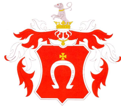
Рис. 7. Гетьман України Петро Конашевич-Сагайдачний (1582-1622) та його герб [12].