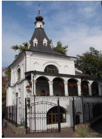
Рис. 3. Дзвіниця церкви Миколи Доброго на вул. Покровська, 6 (сучасна світлина) [4]

Собор Різдва Богородиці та дзвіниця, які відносять до найкращих архітектурних витворів ХVIII століття в Україні, є містобудівними домікантами історичного середмістя Козельця. Собор споруджено у 1752–1763 рр. на замовлення графині Наталії Розумовської (по-місцевому – Розумихи , матері Олексія та Кирила Розумовських) архітекторами Іваном Григоровичем-Барським та Андрієм Квасовим – на знак подяки Богові за щасливу долю синів замовниці. Храм мурований, хрещатий, дев'ятидільний. Рамена завершено напівкруглими ризалітами. В середині чотири опорні стовпи несуть систему склепінь і п'ять бань, поставлених по діагоналі (як у